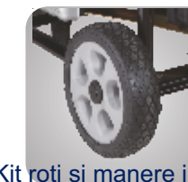
Kit roti si manere in