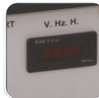
Contor ore, echipare standard pentru voltmetru si frecventa SC-5000 si SC-6000