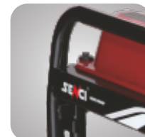
Cadru tratat pentru a preveni ruginirea