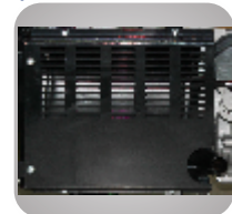
Esapament unic ce reduce zgomotul