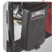
Filtru de aer patentat